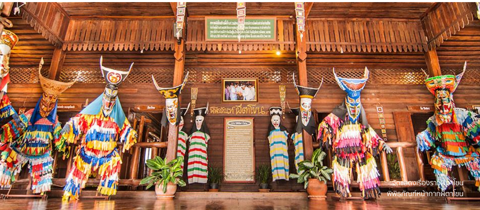
จัดแสดงเรื่องราวผีตาโขน พิพิธภัณฑ์ หน้ากากผีตาโขน

นำท่านเดินทางสู่ วัดโพธิชัย อ.ด่านซ้าย ระยะทางประมาณ 29 กม. ให้ท่านสักการะ พระเจ้าใหญ่ (พระประธานในพระอุโบสถ วัดโพธิชัย) พระพุทธรูปศักดิ์สิทธิ์ คู่บ้านคู่อเมืองด่านซ้าย และภายในวัดโพธิชัยแห่งนี้ยังเป็นที่ตั้งของ พิพิธภัณฑ์หน้ากากผีตาโขน หน้ากากผีตาโขนเป็นเหมือนสัญลักษณ์ที่ถ่ายทอดวิถีชีวิตของคนด่านซ้าย ลวดลายบนหน้ากากนั้นเป็นศิลปะที่ไม่เหมือนใครควรค่าแก่การอนุรักษ์ ให้ท่านชมหน้ากากผีตาโขนที่เกิดจากความคิดสร้างสรรค์ของศิลปินและช่างวาดของคนด่านซ้าย