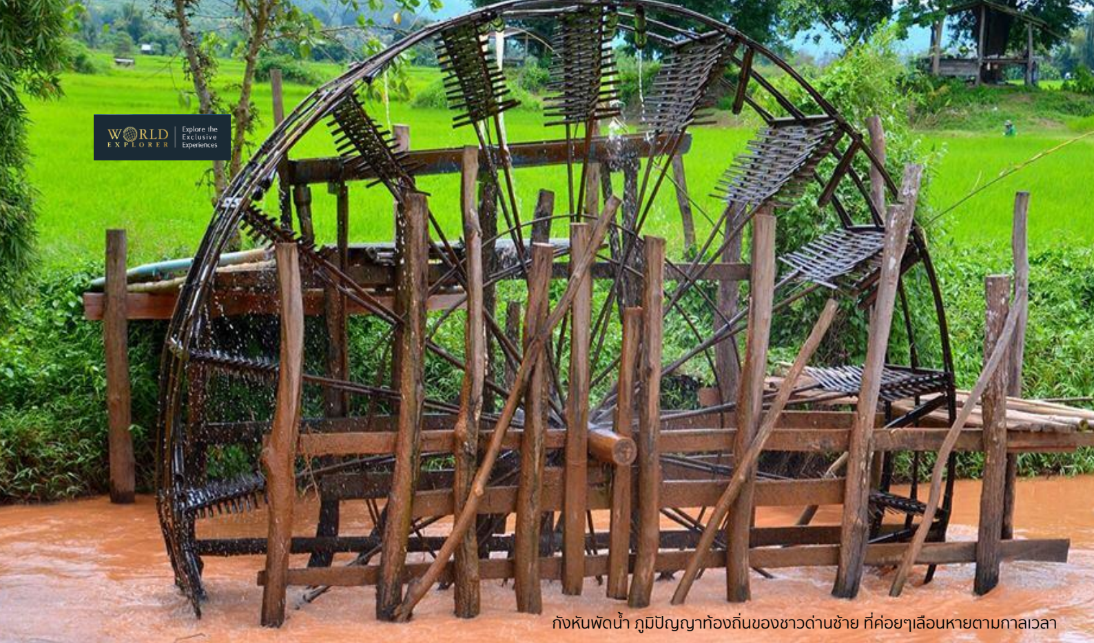
กังหันพืดน้ำ ภูมิปัญญาท้องถิ่นของชาวด่านซ้าย ที่ค่อยๆ เลือนหายตามกาลเวลา

เมื่อเดินทางถึง บ้านนาเวียงใหญ่ ให้ท่านชม กังหันพืดน้ำ เป็นเครื่องจักรที่ทำด้วยไม้ช่วยผันน้ำจากที่ต่ำไปยังที่สูงโดยไม่ใช่น้ำมัน ถือเป็นภูมิปัญญาท้องถิ่น ที่อาศัยธรรมชาติของการไหลของสายน้ำมาใช้ให้เกิดประโยชน์