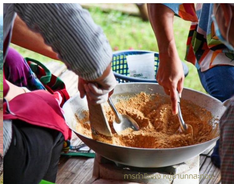
การทำชิงพง หมู่บ้านกกระทอน