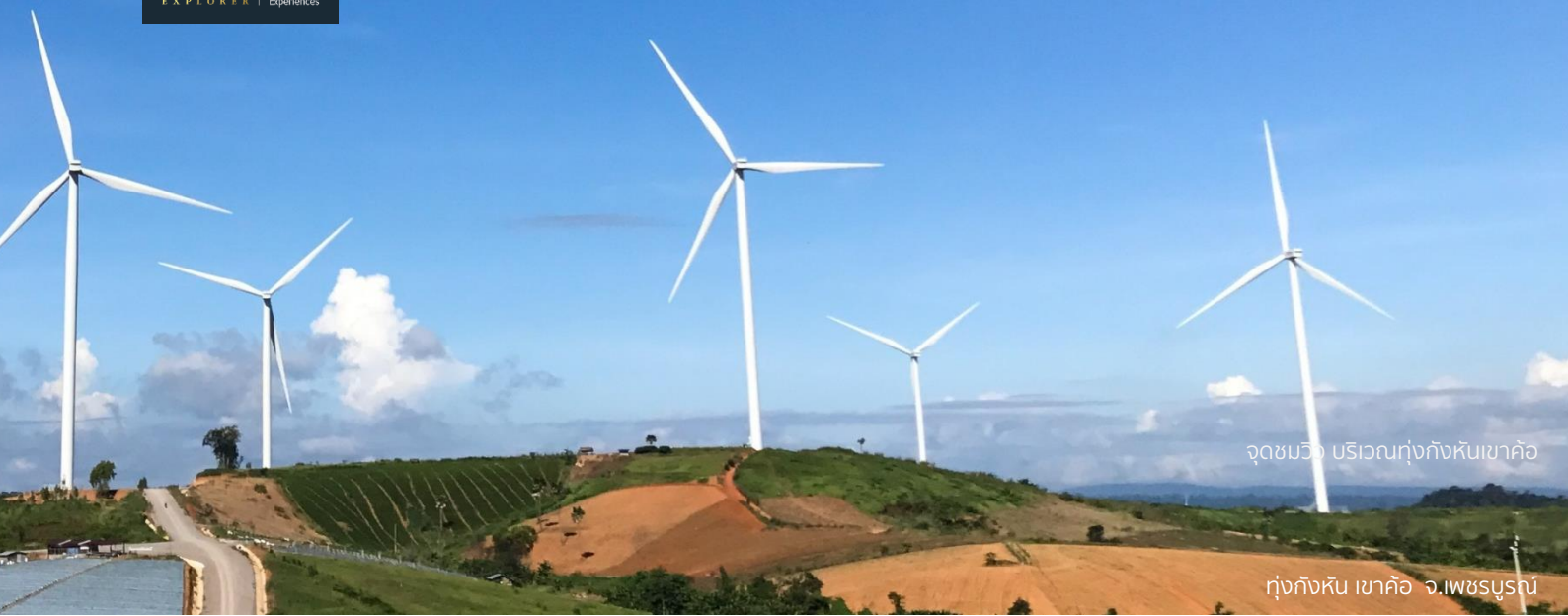
จุดชมวิว บริเวณทุ่งกังหันเขาค้อ