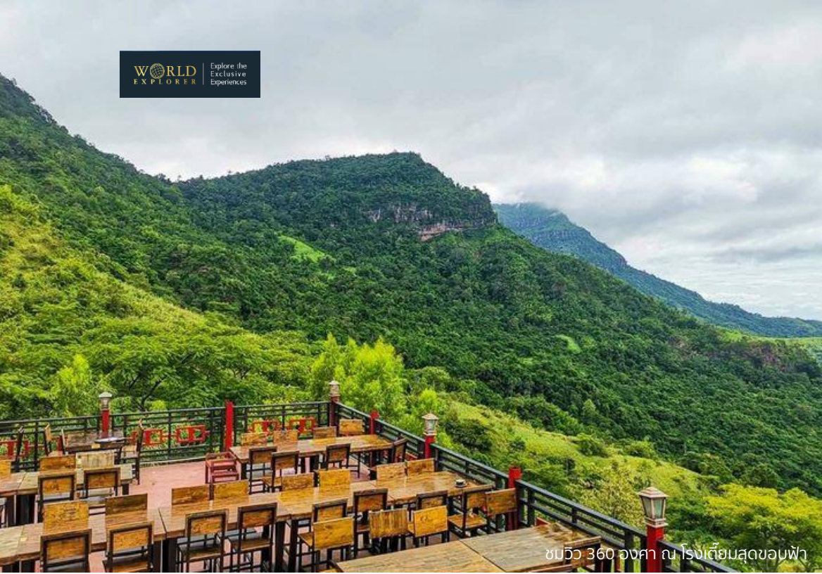
ชมวิว 360 องศา ณ โรงเตี้ยมสุดขอบฟ้า