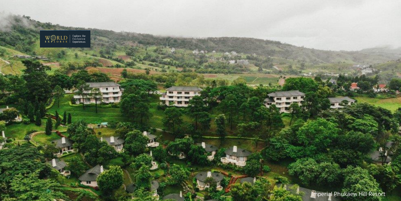
Imperial Phukaew Hill Resort

วันที่สองของการเดินทาง จ.เพชรบูรณ์ วิวเขาตะเคียนโง๊ะ – ทุ่งกังหันชาค้อ – วัดพระธาตุผาซ่อนแก้ว – อ.ด่านซ้าย จ.เลย – วัดบรมนิวาสีนา – พระธาตุศรีสองรัก