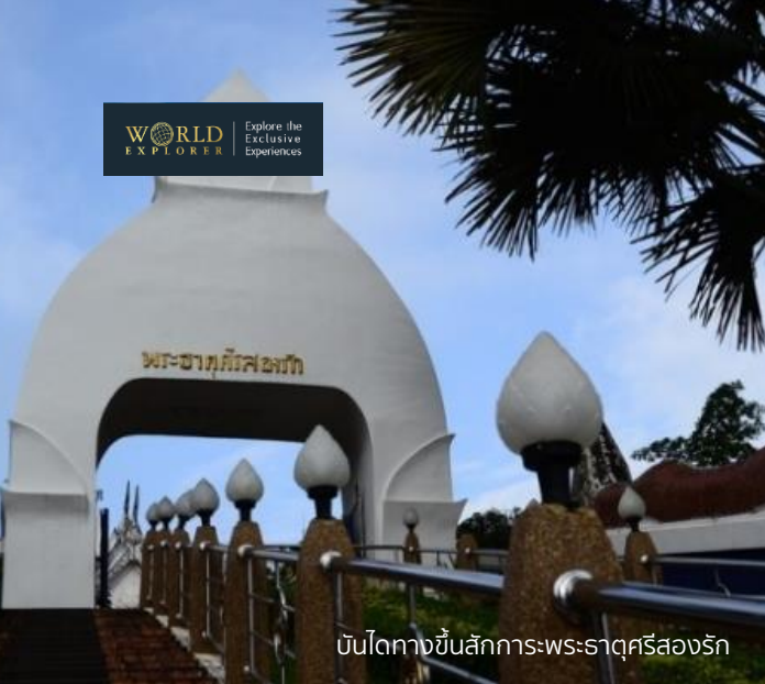
บันไดทางขึ้นสักการะพระธาตุศรีสองรัก