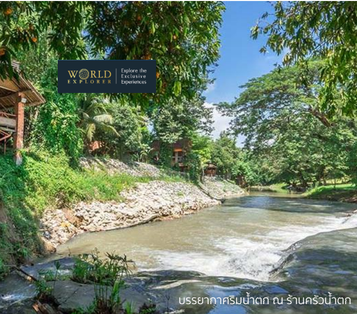
บรรยากาศริมน้ำตก ณ ร้านครัวน้ำตก