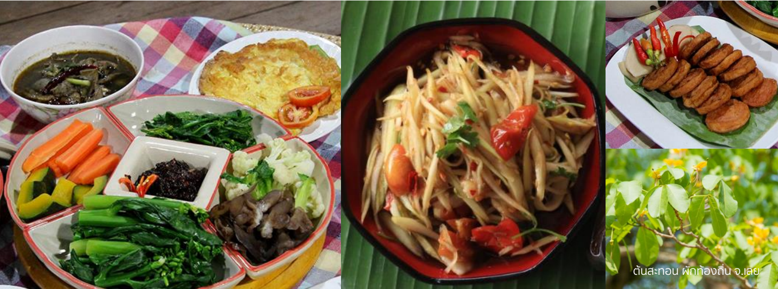
ต้นสะทอน ผักท้องถิ่น จ.เลย

รับประทานอาหารกลางวันกับเมนูอาหารพื้นบ้านจากเซฟครั่วมชน ลิ้มรสอาหารที่ปรุงรสด้วยน้ำผักสะทอน (น้ำปรุงรสจากผักสะทอน ผักท้องถิ่นที่หาทานยาก) เมนูแนะนำ : ต้มข้าวไก่กาดำ น้ำพริกแจ่วดำผักสะทอนผัดสด ยำหัวปลีกล้วยป่า (กล้วยฮอก) ส้มตำน้ำผักสะทอน ปลาทอด หมูยอกทอด ไช้เจียวหมูสับ ผลไม้ตามฤดูกาล ฯลฯ