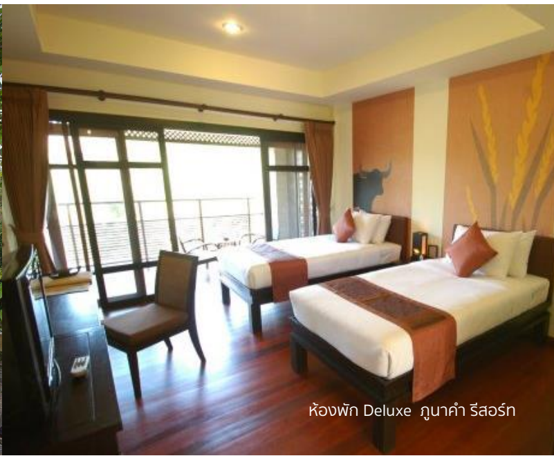
ห้องพัก Deluxe ภูนาคำ รีสอร์ท