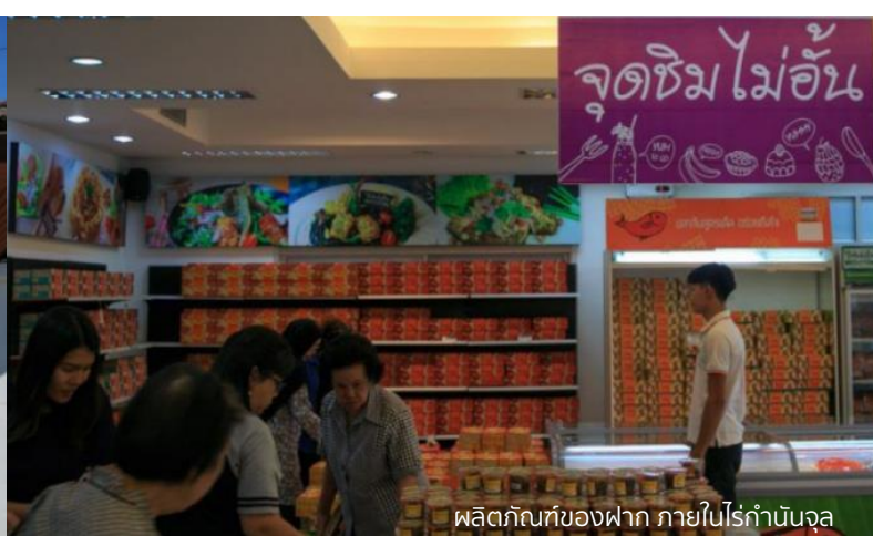
ผลิตภัณฑ์ของฝาก ภายในไร่กำนันจุล

12.30 น. นำท่านเดินทางเข้าสู่ อ.วิเชียรบุรี ระยะทางประมาณ 57 กม. 13.30 น. รับประทานอาหารกลางวัน ณ ร้านนิวโก้ย่างบัวตอง สาขา 2 อ.วิเชียรบุรี