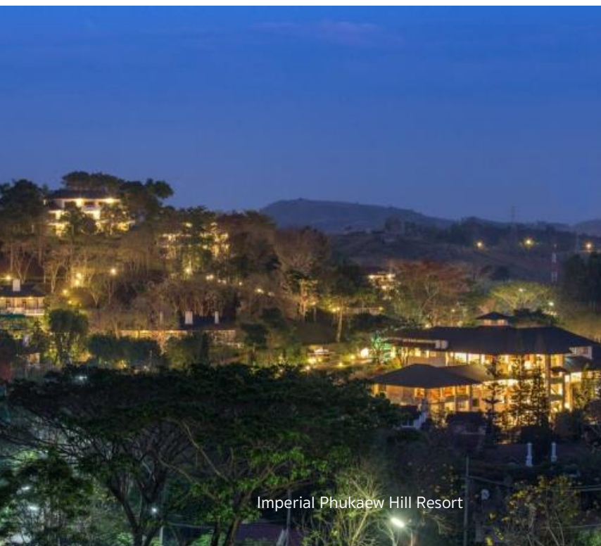
Imperial Phukaew Hill Resort