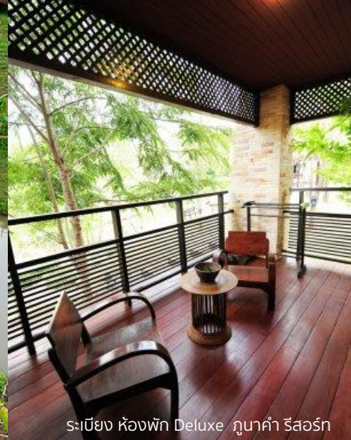
ระเบียง ห้องพัก Deluxe ภูาคำ รีสอร์ท