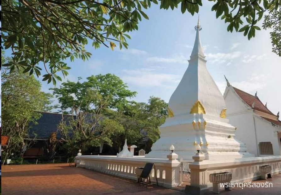
พระธาตุศรีสองรัก

16.10 น. ให้ท่านสักการะ พระธาตุศรีสองรัก ตัวพระธาตุมีศิลปกรรมแบบล้านช้างที่คล้ายกับองค์พระธาตุพนม เป็นพระธาตุที่สร้างขึ้นเพื่อเป็นสักขีพยานแห่งไมตรีในการช่วยเหลือกัน ระหว่างกรุงศรีอยุธยาและอาณาจักรล้านช้าง (ลาว) *การแต่งกายเพื่อสักการะองค์พระธาตุศรีสองรักนั้น ไม่ให้แต่งกายสีแดง เพราะสีแดงหมายถึง เลือด การสู้รบ และการเป็นศัตรู