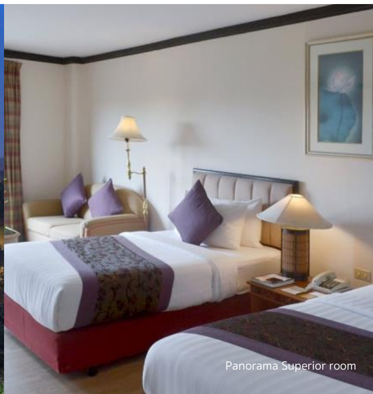
Panorama Superior room