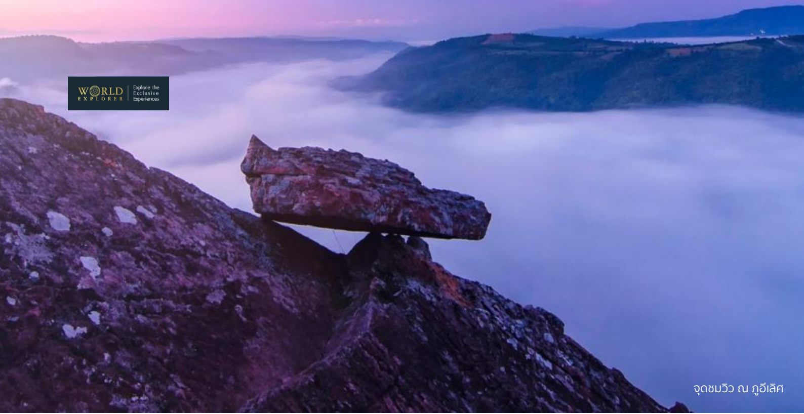
จุดชมวิวน ภูฮิลีศ